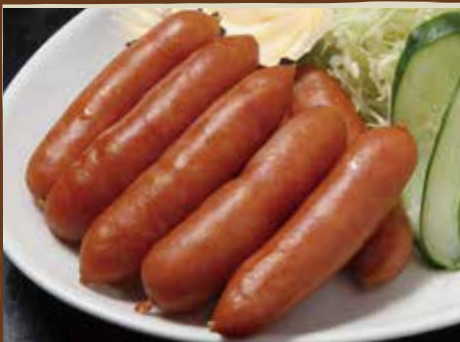
ポーク うどん 500円 (税込)