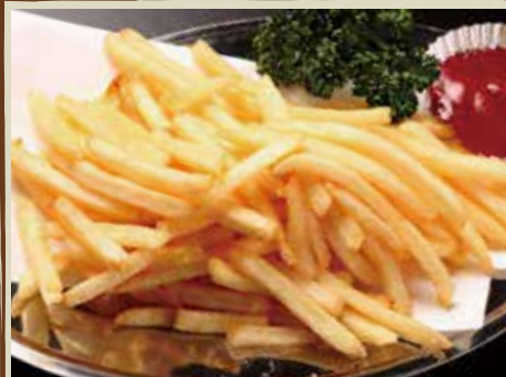
フレンチ フライドポテト 400円 (税込)