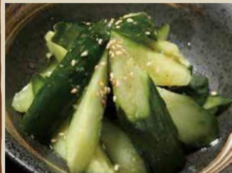
やみつぎ キュウリ 400円 (税込)