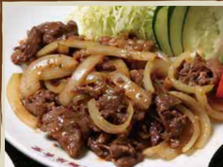
ジンギスカン 炒め 740円 (税込)