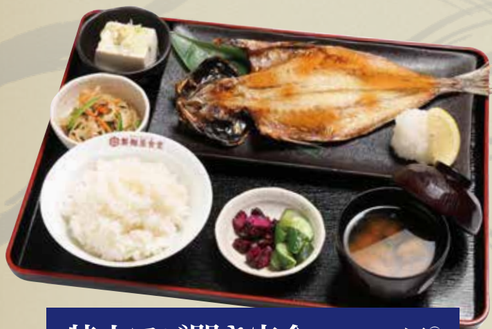
特大アジ開き定食 1,020円 (税込)