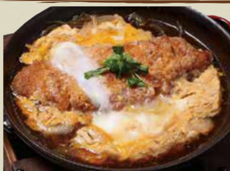
かつ煮 950円 (税込)