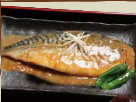
鯖の味噌煮 790円 (税込)