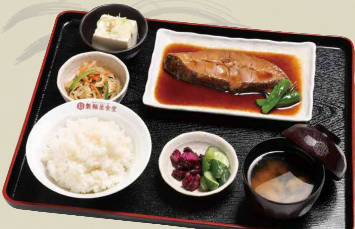
銀ガレイ煮付け定食 1,020円 (税込)

脂が乗った「銀ガレイ」は生姜風味の甘醤油ダレとの相性が抜群。煮魚料理の人気ナンバーワンです。