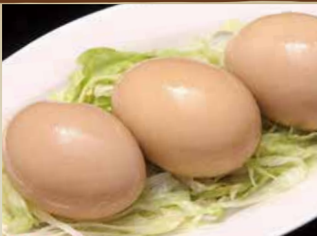
おつまみ 煮玉子 330円 (税込)