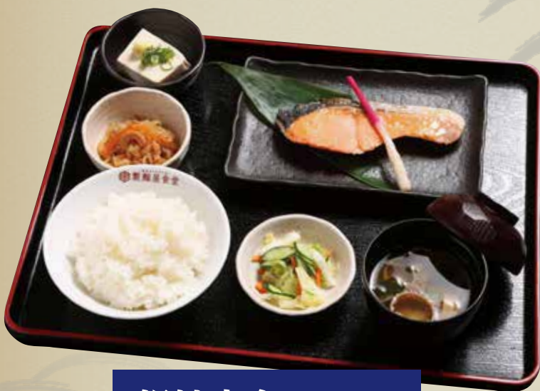
銀鮭定食 880円 (税込)

特選肉厚しまほっけの一夜干し開きを丁寧に焼き上げました。ジューシーで脂乗りが最高の逸品。