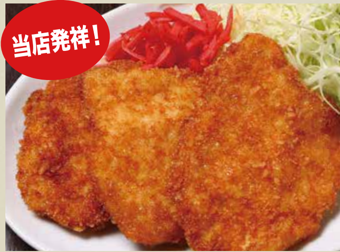
おつまみ タレカツ 400円 (税込)