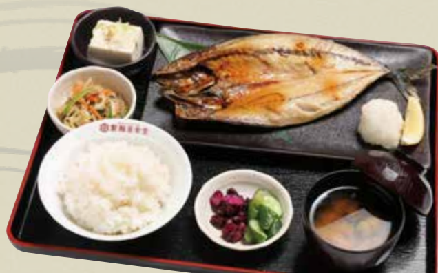
特大真サバ開き定食 1,020円 (税込)

サバは開いて干物にすることにより、驚くほど旨味・脂乗り・ジューシーさなどが増します。