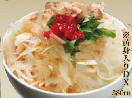
オニオン スライス ※黄身入りDX 380円 (税込) 330円 (税込)