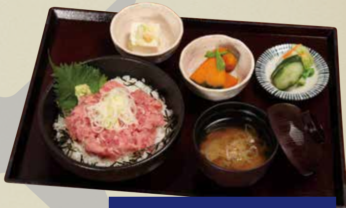
ネギトロ定食 990円 (税込)