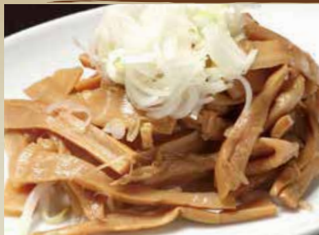
おつまみ メンマ 400円 (税込)