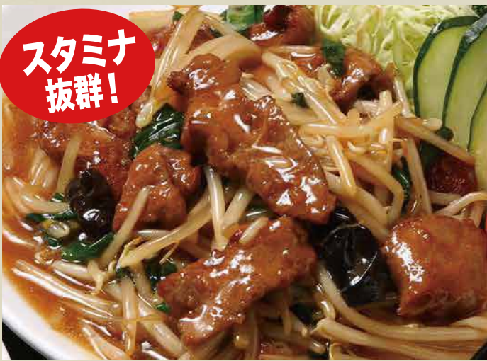
レバニラ炒め 740円 (税込)