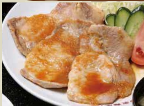
生姜焼き 740円 (税込)