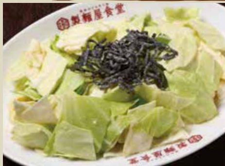
やみつぎ キャベツ 400円 (税込)