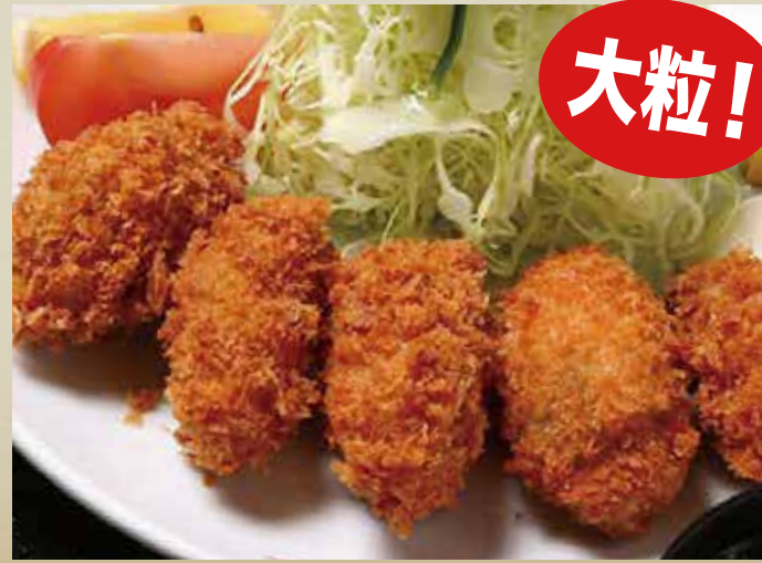
大粒牡蠣 フライ 950円 (税込)