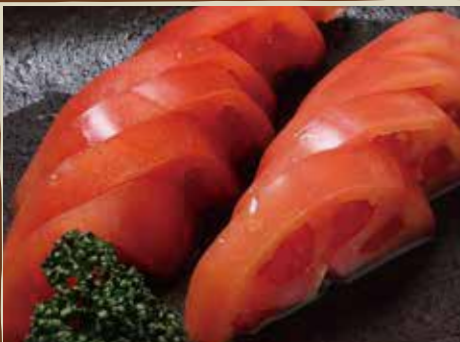
冷やしトマト 400円 (税込)