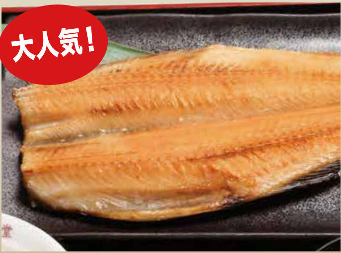
特大 シマホツケ焼き 1,000円 (税込)