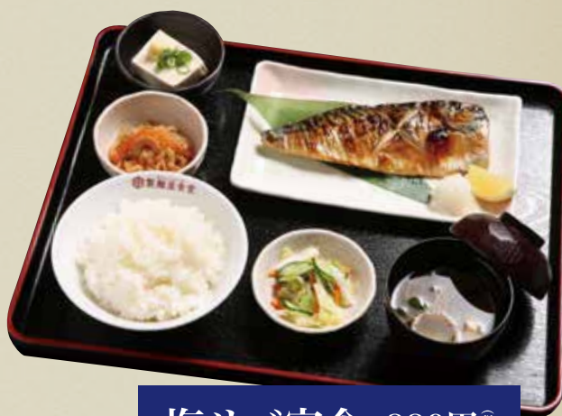
塩サバ定食 880円 (税込)