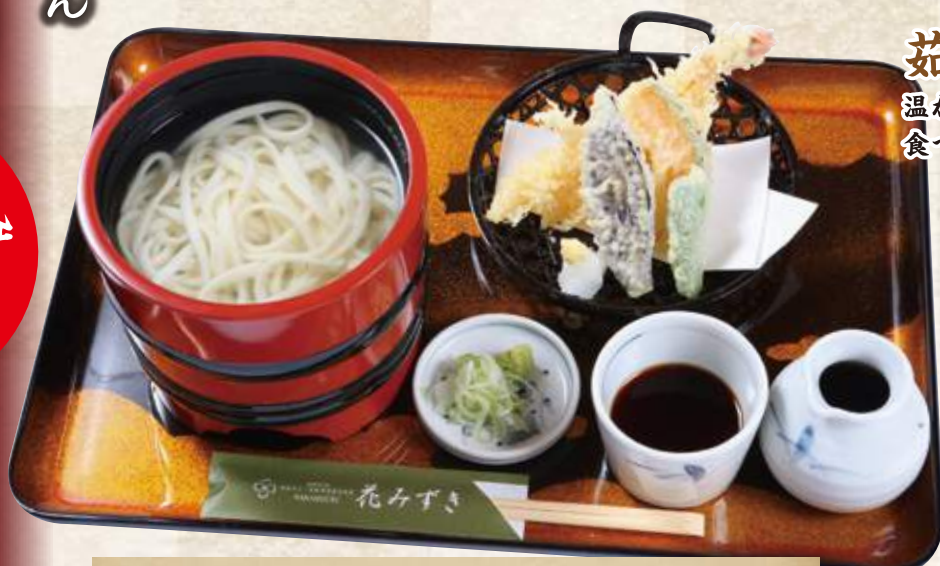
天釜揚げうどん 1,500円 (税込1,650円)

温かいうどんを当店自慢のつけ汁でどうぞ。 食べ終わるまでアツアツのままお召し上がり頂けます。