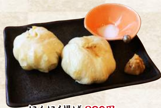
にんにく揚げ 390円 (税込429円)