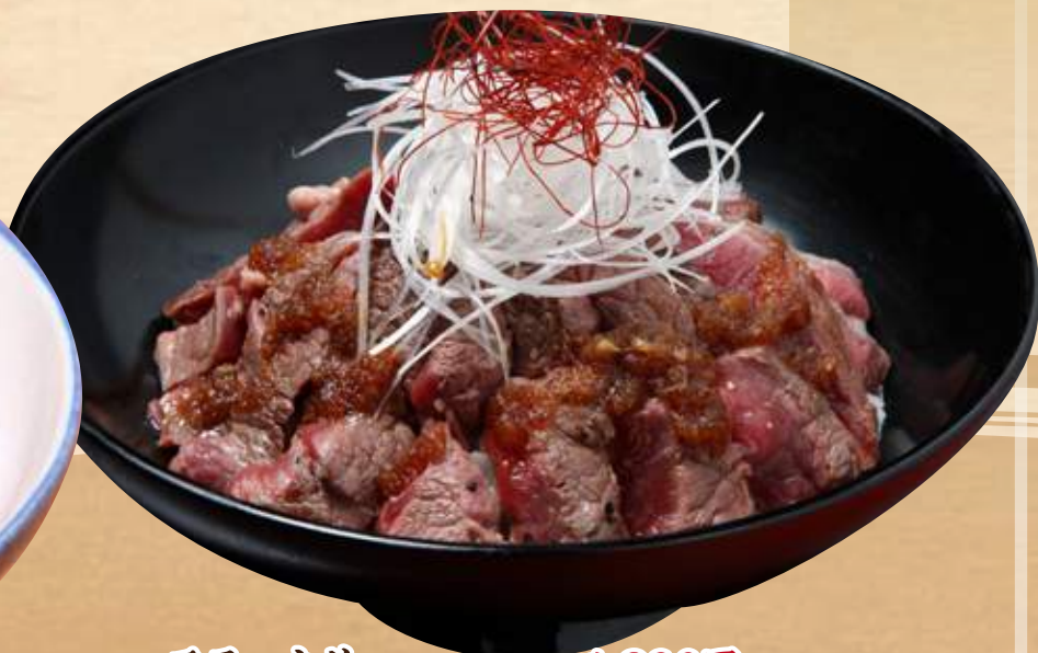
ステーキ丼(味噌汁・漬物付) 1,380円(税込1,518円)