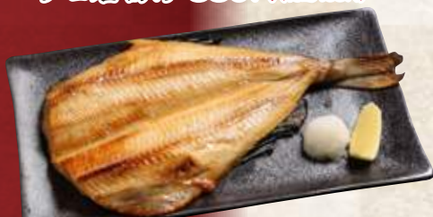
特大縞ほっけ 1,380円 (税込1,518円)