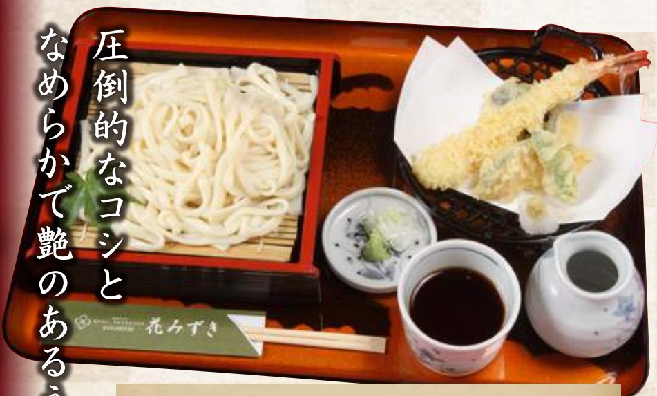
天ざるうどん(1人前) 1,500円 (税込1,650円)