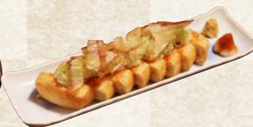
Ebiの油揚げ 600円 (税込660円)