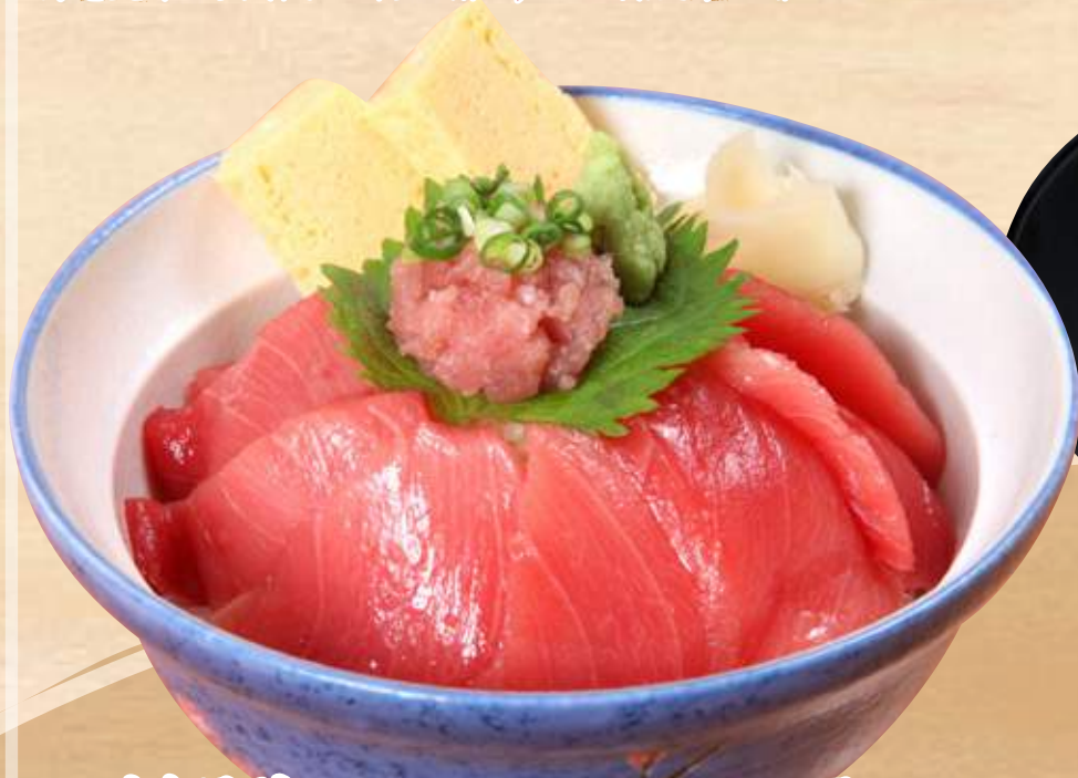
海老天丼セット(半そばor半うどん付) 1,380円(税込1,518円)