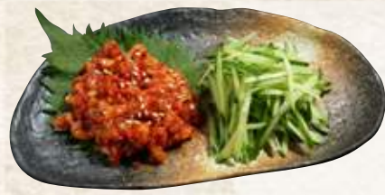
チャンジャ 520円 (税込572円)