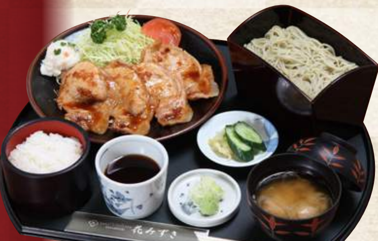
生姜焼き定食セット(半そばor半うどん付) 1,500円 (税込1,320円) 生姜焼き定食(味噌汁・漬物付) 1,200円 (税込1,320円)