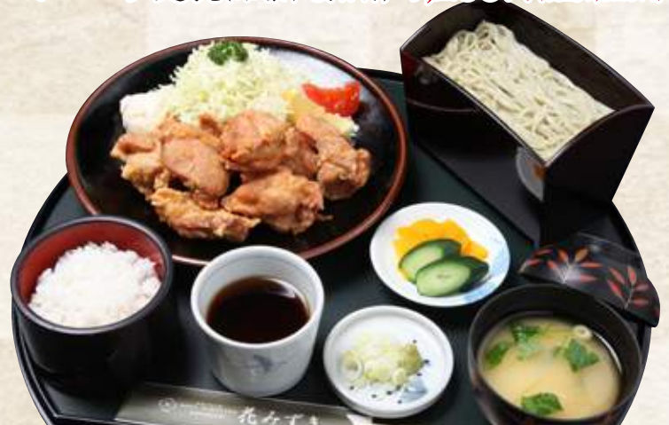
唐揚げ定食セット(半そばor半うどん付) 1,500円 (税込1,650円) 唐揚げ定食(味噌汁・漬物付) 1,200円 (税込1,320円)