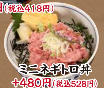
ミニネギトロ丼 +480円 (税込528円)