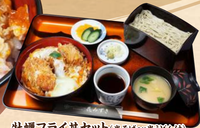
牡蠣フライ丼セット(半そばor半うどん付) 1,380円(税込1,518円)