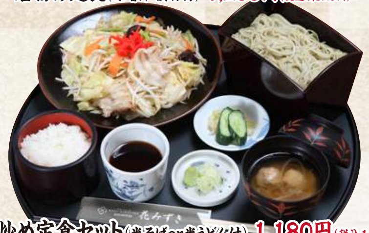
野菜炒め定食セット(半そばor半うどん付) 1,180円 (税込1,298円) 野菜炒め定食(味噌汁・漬物付) 880円 (税込968円)