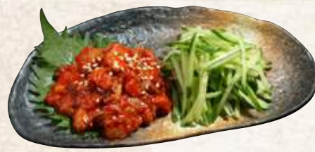
タコキムチ 520円 (税込572円)