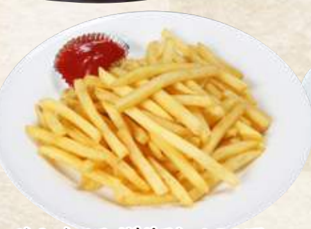
フレンチフライポテト 480円(税込528円)