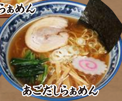
あごだしらあめん