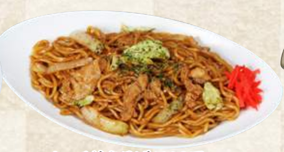
ソース焼きそば 710円(税込781円)