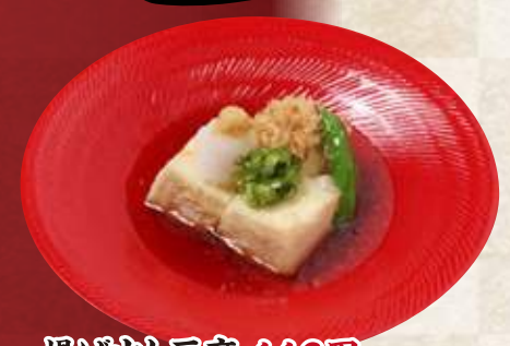
揚げ出し豆腐 440円(税込484円)