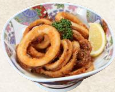
イカ揚げ 820円 (税込902円)