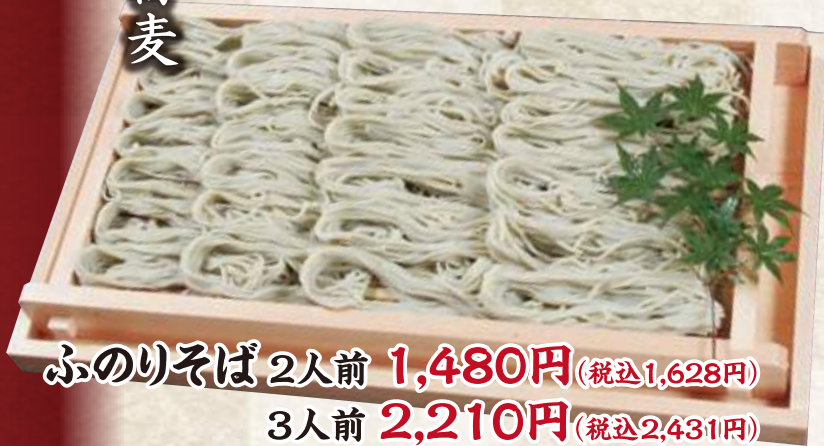
ふのりそば 2人前 1,480円 (税込1,628円)