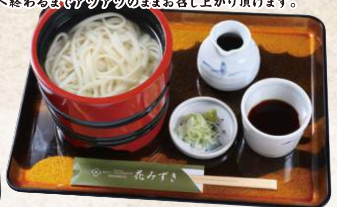
釜揚げうどん 750円 (税込825円)