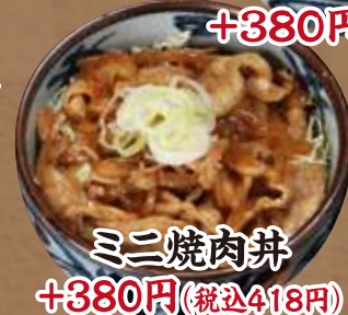
ミニ焼肉丼 +380円 (税込418円)