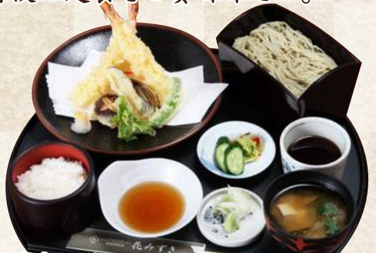
天ぷら定食セット(半そばor半うどん付) 1,680円 (税込1,848円) 天ぷら定食(味噌汁・漬物付) 1,380円 (税込1,518円)