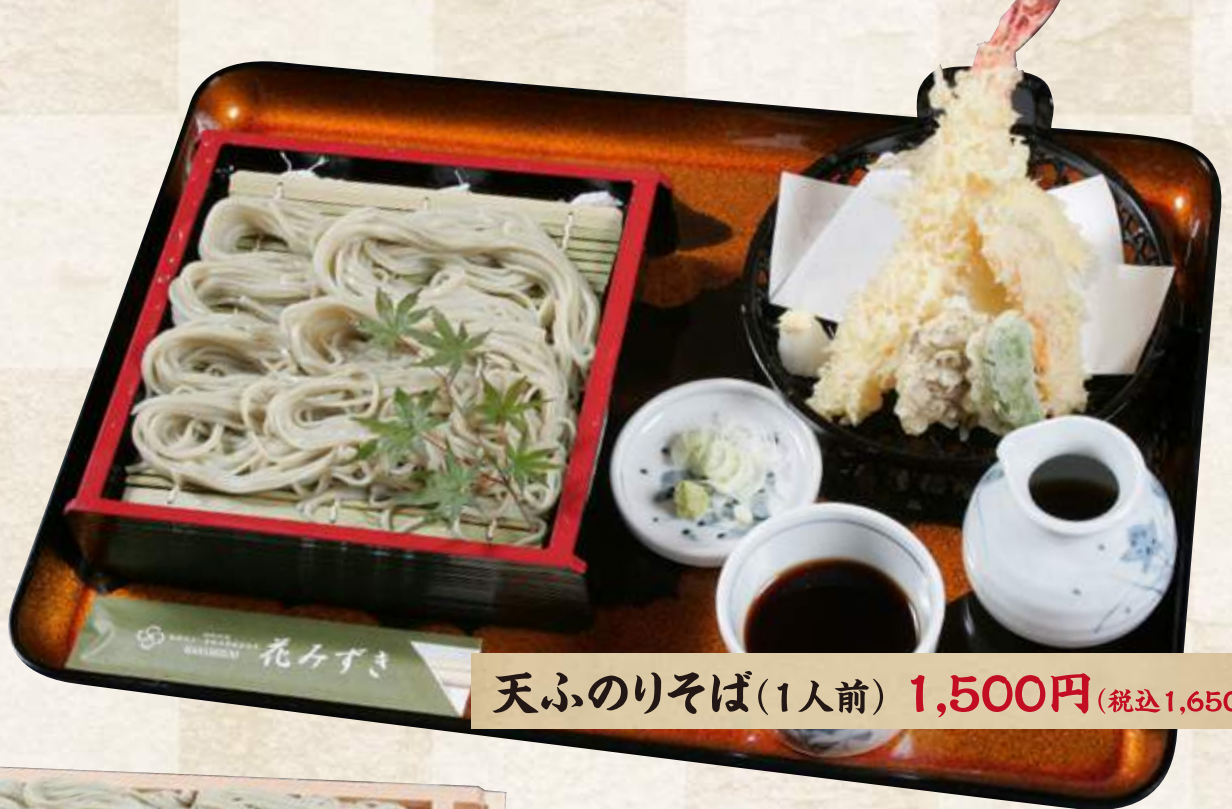
天ふのりそば(1人前) 1,500円 (税込1,650円)