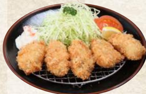
大粒牡蠣フライ 1,100円 (税込1,210円)