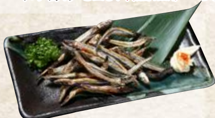
五島きびなご一夜干し炙り 490円 (税込539円)