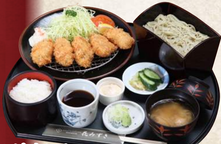
牡蠣フライ定食セット(半そばor半うどん付) 1,680円 (税込1,848円) 牡蠣フライ定食(味噌汁・漬物付) 1,380円 (税込1,518円)