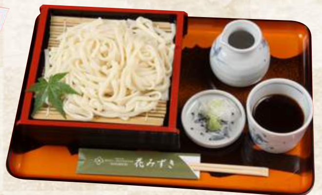
ざるうどん(1人前) 750円 (税込825円)