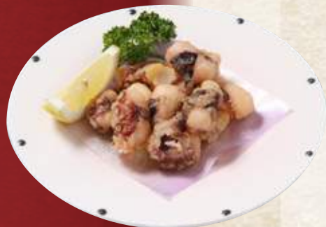
タコ唐揚げ 880円 (税込968円)