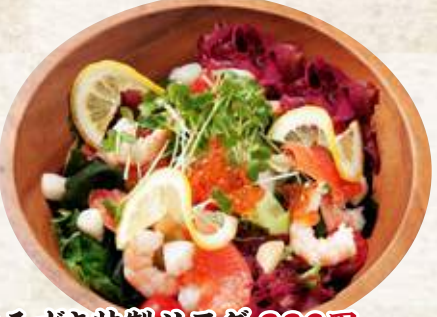
花みずき特製サラダ 880円(税込968円)