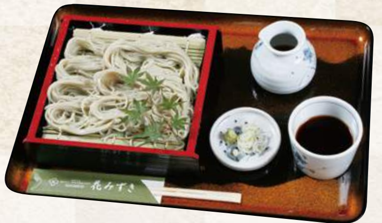
ふのりそば(1人前) 750円 (税込825円)