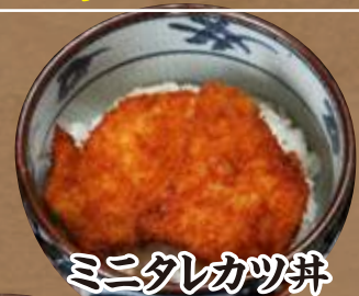
ミニタレカツ丼 +380円 (税込418円)