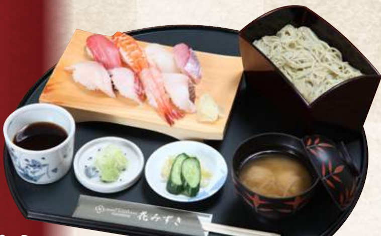
寿司定食セット(半そばor半うどん付) 1,880円 (税込2,068円) 寿司定食(味噌汁・漬物付) 1,580円 (税込1,738円)