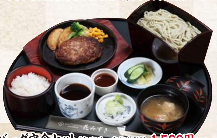
ハンバーグ定食セット(半そばor半うどん付) 1,500円 (税込1,650円) ハンバーグ定食(味噌汁・漬物付) 1,200円 (税込1,320円)