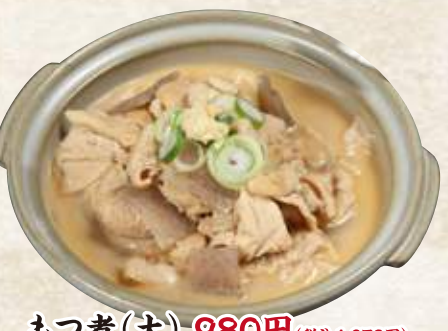
もつ煮(大) 980円(税込1,078円) (小) 500円(税込550円)