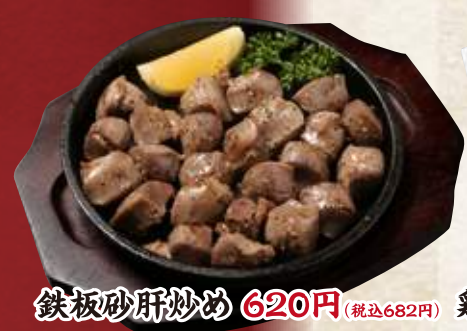
鉄板砂肝炒め 620円(税込682円)