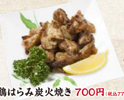
鶏はらみ炭火焼き 700円(税込770円)