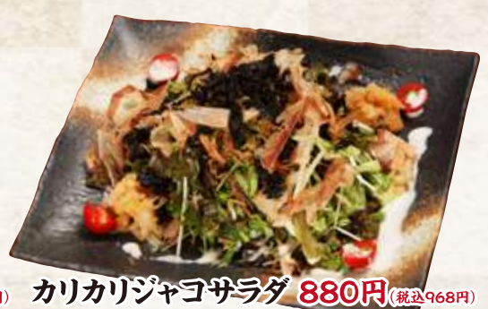
カリカリジャコサラダ 880円(税込968円)