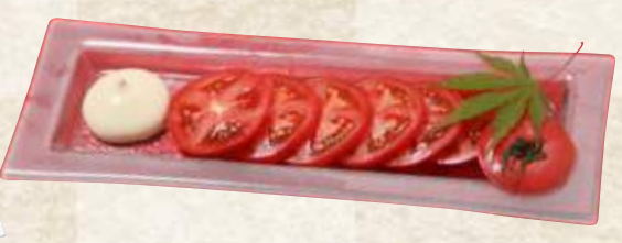
トマトスライス 370円(税込407円)