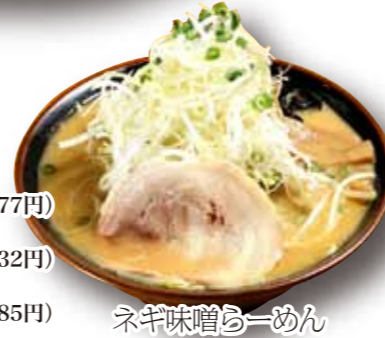
ネギ味噌らーめん