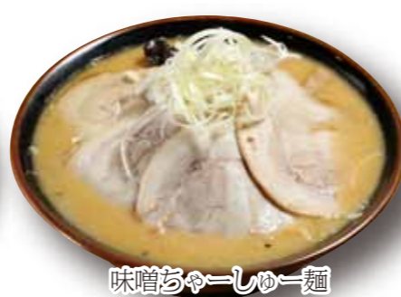
味噌チャーシュー麺