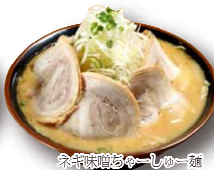
ネギ味噌チャーシュー麺