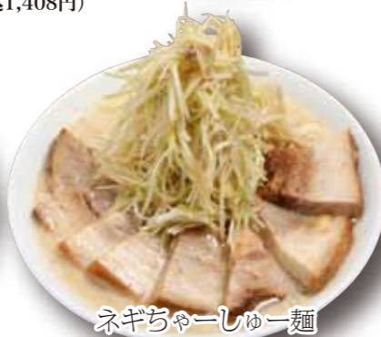
ネギチャーシュー麺