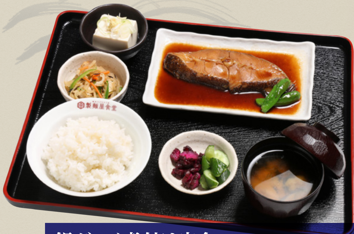
銀ガレイ煮付け定食 1,320円(税込1,452円)

脂が乗った「銀ガレイ」は生姜風味の甘醤油ダレとの相性が抜群。煮魚料理の人気ナンバーワンです。