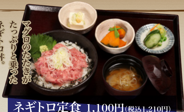
ネギトロ定食 1,100円(税込1,210円)