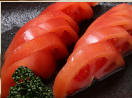
冷やし トマト 410円 (税込451円)