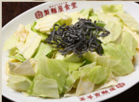
やみつぎ キヤベツ 410円 (税込451円)