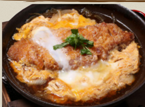
かつ 煮 1,050円 (税込1,155円)