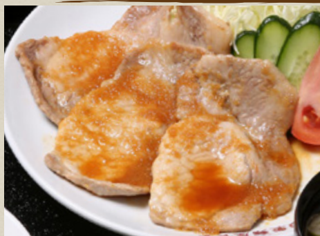
生姜 焼き 750円 (税込825円)