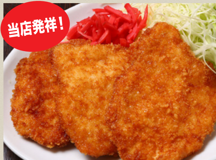
おつまみ タレカツ 410円 (税込451円)