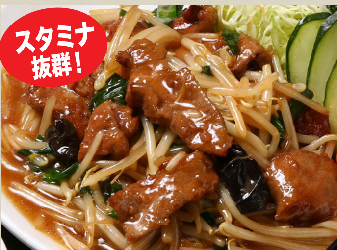
レバニラ炒め 780円 (税込858円)