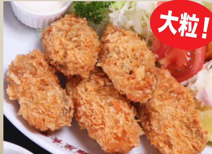
大粒 牡蠣 フライ 1,280円 (税込1,408円)