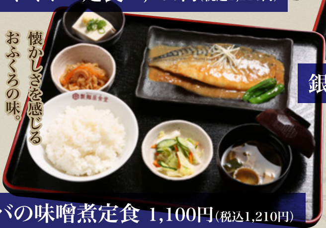
サバの味噌煮定食 1,100円(税込1,210円)