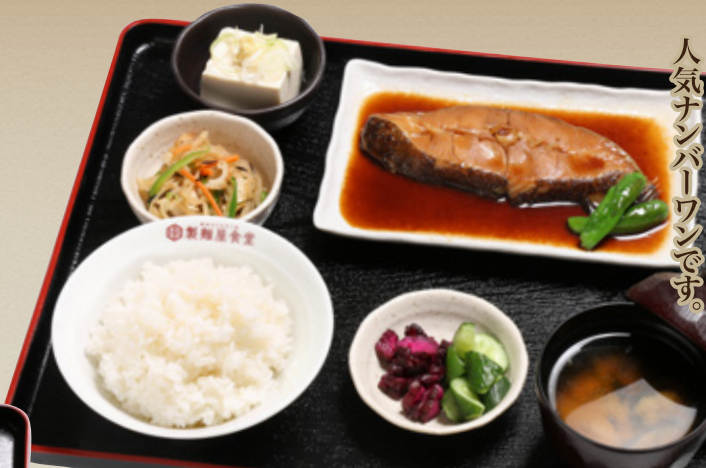
銀ガレイ煮付け定食 1,320円(税込1,452円)

脂が乗った「銀ガレイ」は生姜風味の甘醤油ダレとの相性が抜群。煮魚料理の人気ナンバーワンです。