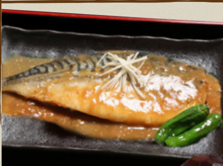
鯖の味噌煮 900円 (税込990円)