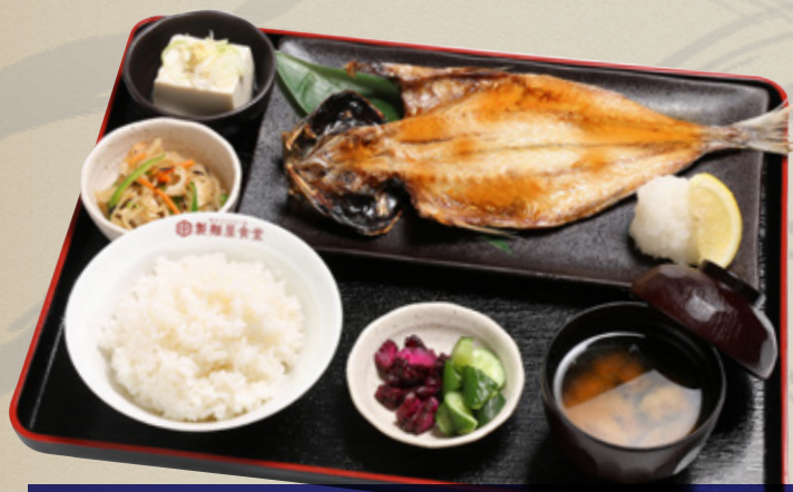
特大アジ開き定食 1,100円(税込1,210円)