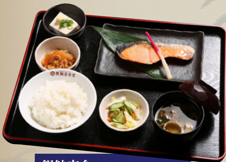
銀鮭定食 1,100円(税込1,210円)