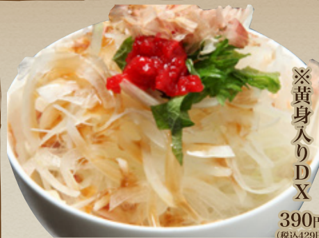
オニオン スライス 330円 (税込363円) ※黄身入りDX 390円 (税込429円)