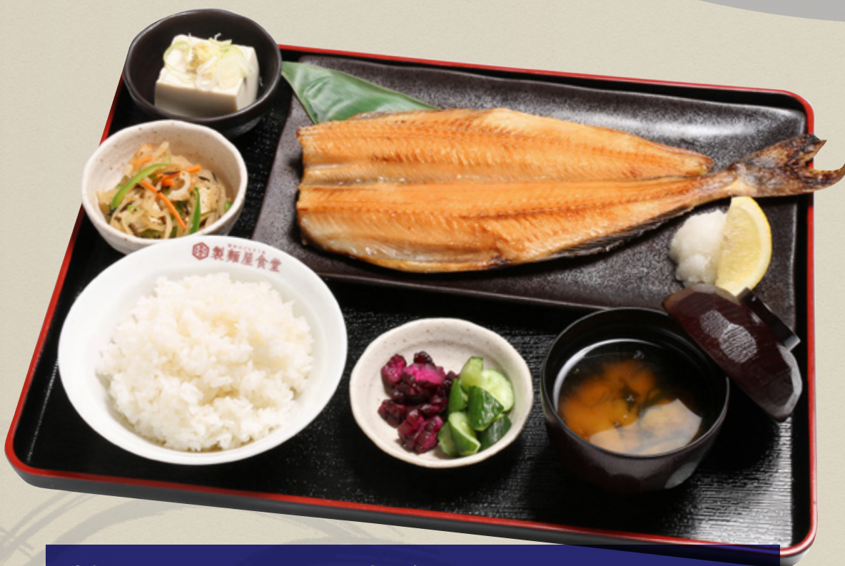
特大しまほっけ定食 1,430円(税込1,573円)

特選肉厚しまほっけの一夜干し開きを丁寧に焼き上げました。ジューシーで脂乗りが最高の逸品。