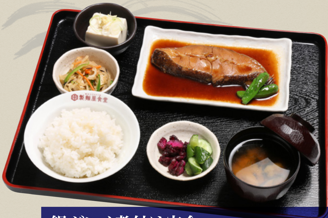
銀ガレイ煮付け定食 1,320円(税込1,452円)

脂が乗った「銀ガレイ」は生姜風味の甘醤油ダレとの相性が抜群。煮魚料理の人気ナンバーワンです。