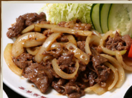
ジンギスカン 炒め 930円 (税込1,023円)