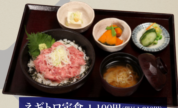
ネギトロ定食 1,100円(税込1,210円)