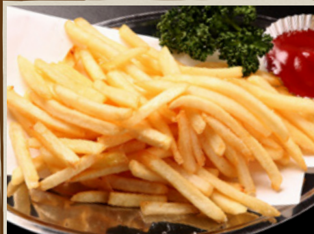
フレンチ フライドポテト 410円 (税込451円)