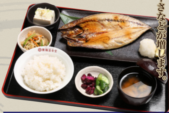
特大真サバ開き定食 1,100円(税込1,210円)

サバは開いて干物にすることにより、驚くほど旨味・脂乗り・ジューシーさなどが増します。