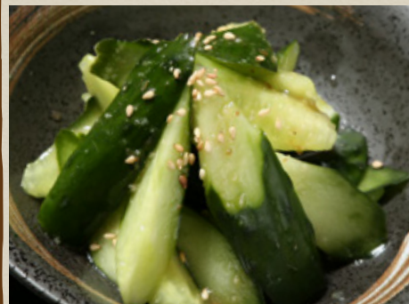
やみつぎ キュウリ 410円 (税込451円)