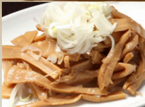
おつまみ メンマ 410円 (税込451円)