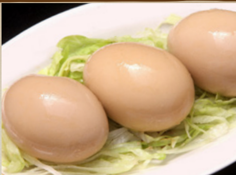
おつまみ 煮玉子 370円 (税込407円)