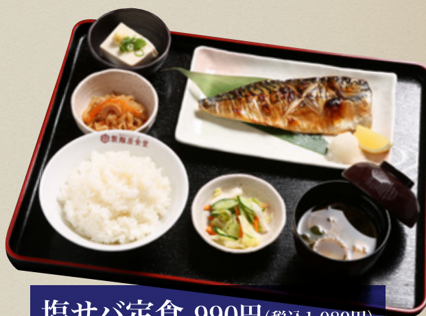
塩サバ定食 990円(税込1,089円)