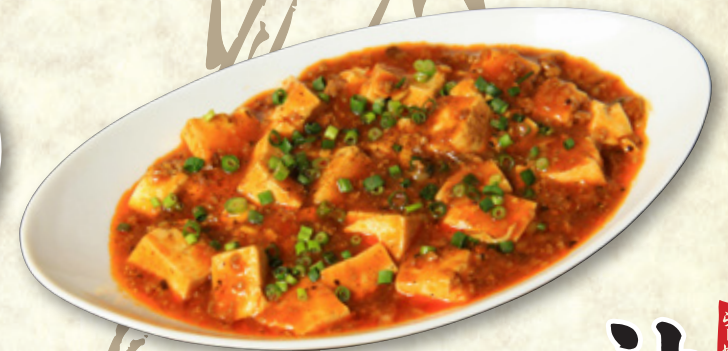
陳麻婆豆腐 820円(税込902円)