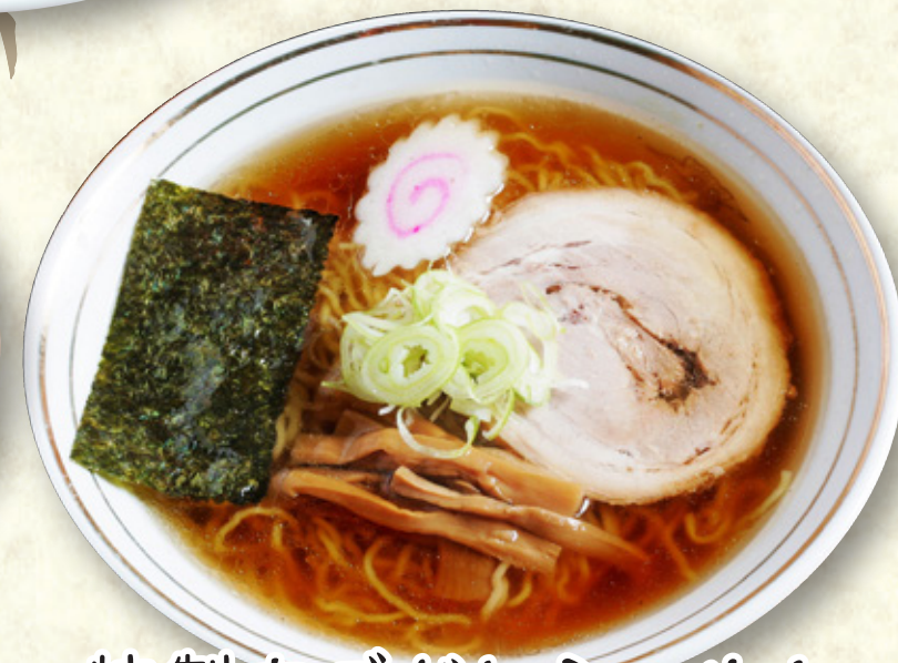
特製あごだしらあめん 880円(税込968円)