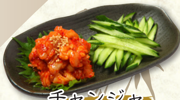
チャンジャ 530円(税込583円)