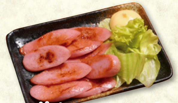
懐かしソーセージ 450円(税込495円)