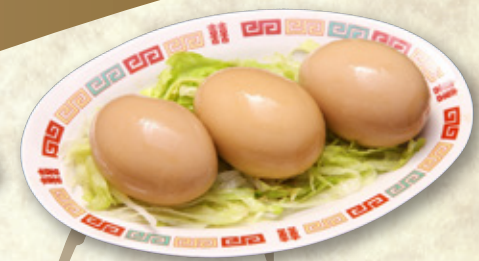
おつまみ煮玉子 390円(税込429円)