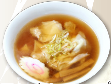
ワンタンスープ 700円(税込770円)