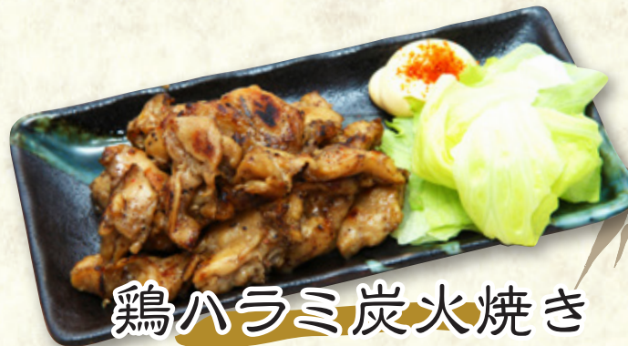
鶏ハラミ炭火焼き 530円(税込583円)