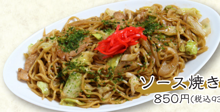
ソース焼きそば 850円(税込935円)