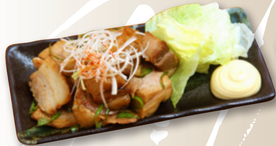
おつまみコロチャーシュー 640円(税込704円)