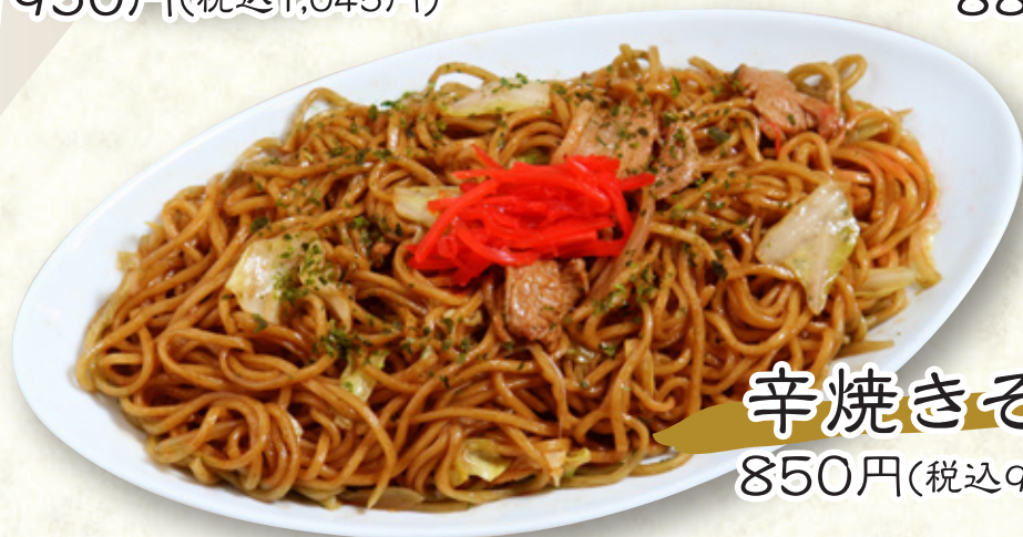
辛焼きそば 850円(税込935円)