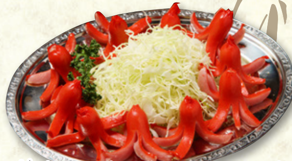
懐かしのタコちゃんウインナー 640円(税込704円)