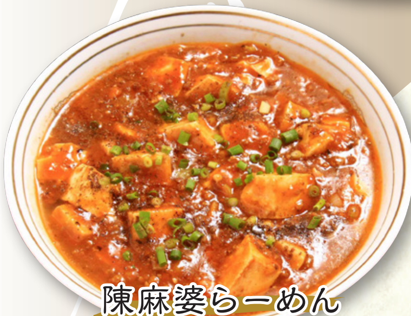
陳麻婆らーめん 950円(税込1,045円)