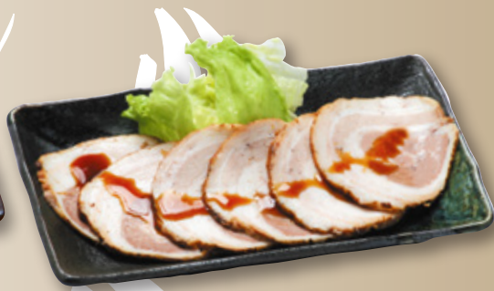
おつまみチャーシュー(バラ) 640円(税込704円)