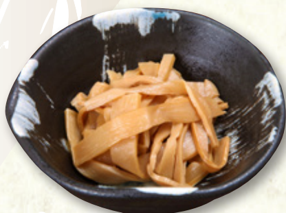
おつまみメンマ 390円(税込429円)