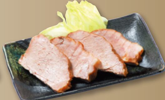
おつまみチャーシュー(肩ロース) 640円(税込704円)