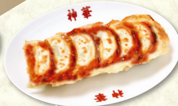
羽根餃子(六個) 640円(税込704円)