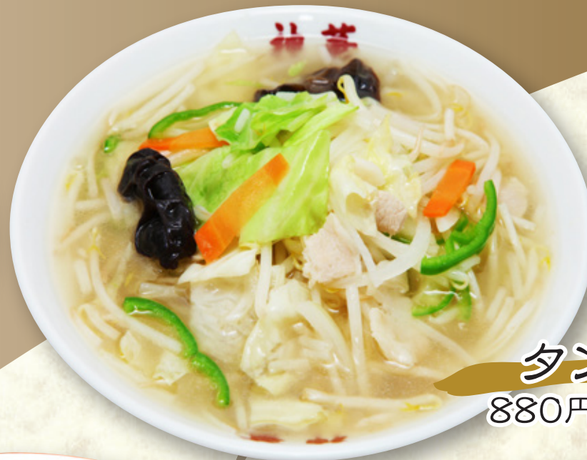
タンメン 880円(税込968円)