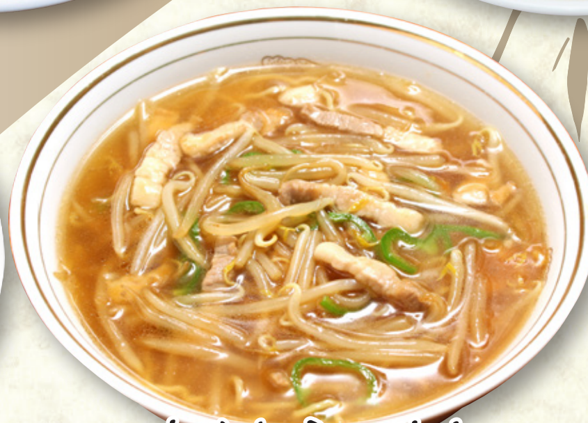
もやしらーめん 880円(税込968円)