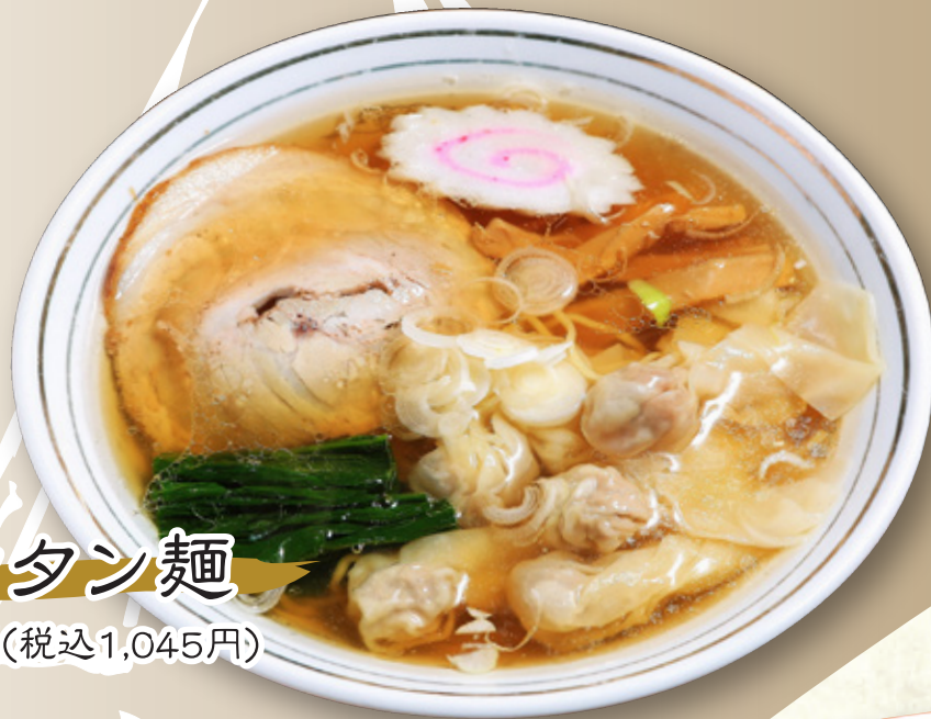
ワンタン麺 950円(税込1,045円)