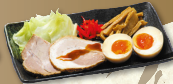
おつまみ三品セット 680円(税込748円)