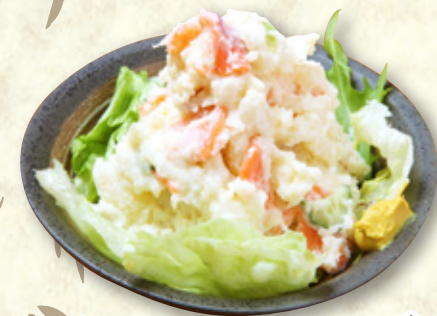
ポテトサラダ 330円(税込363円)