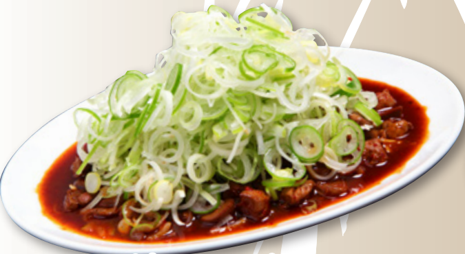
純レバ炒め 880円(税込968円)