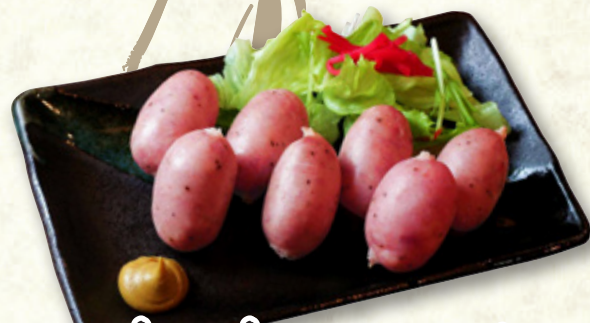
プリプリウインナー 750円(税込825円)