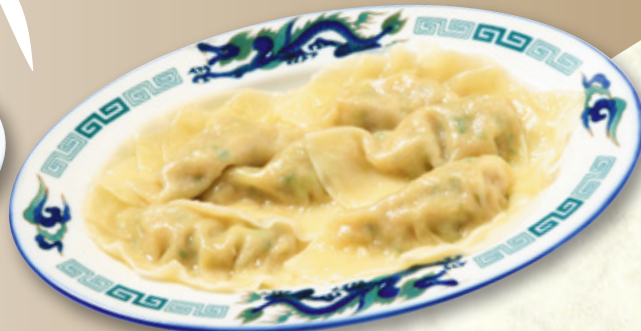
水餃子(六個) 680円(税込748円)